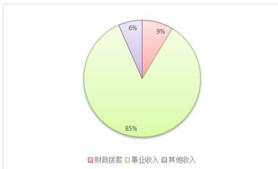
2021 年度本年收入结构图示：